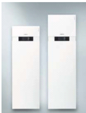
Vitocal 222-G (vas.) Vitocal 242-G (oik.)