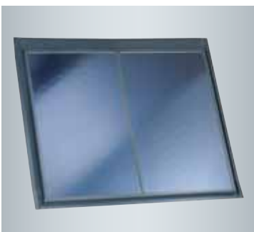
Laajapintainen tasokeräin Vitosol 200-F (tyyppi 5DIA) on saatavilla 4,75 m 2 :n keräinpinta-alalla.