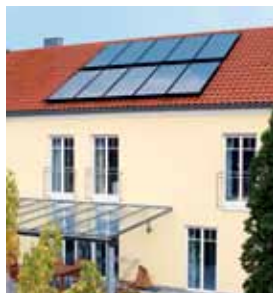
Vitosol 200-F Paritalo Geisenfeldissä