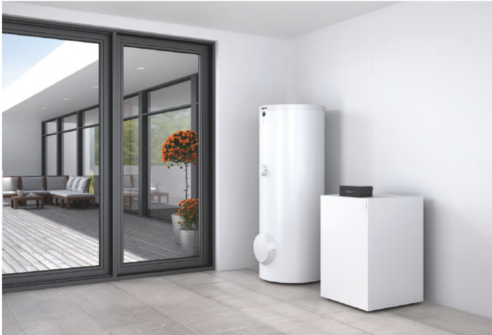
Lämpöpumppu Vitocal 300-G ja käyttövesivaraaja Vitocell 100-W

Vitocal 300-G maalämpöpumppu on modernin invertteriteknologian ansiosta tehokkain ratkaisu uudisrakennuksiin ja paras valinta laitteiston vaihtoa varten.