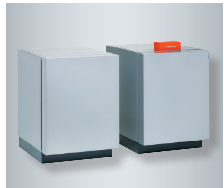
Kaksiportainen Vitocal 350-G (Master/Slave) joko liuos/vesi tai vesi/vesilämpöpumppuna.

Viessmann tarjoaa myös Vitocal 350-G laitteistolle optimoidun järjestelmän yhdessä Vitronic 200 -automatiikan kanssa hyödyntämään auringon tuottamaa ilmaista energiaa lämpimän käyttöveden valmistuksessa.