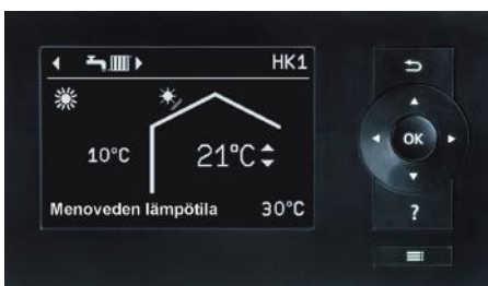
Lämpöpumppuautomaatiikka Vitotronic 200:n näyttö