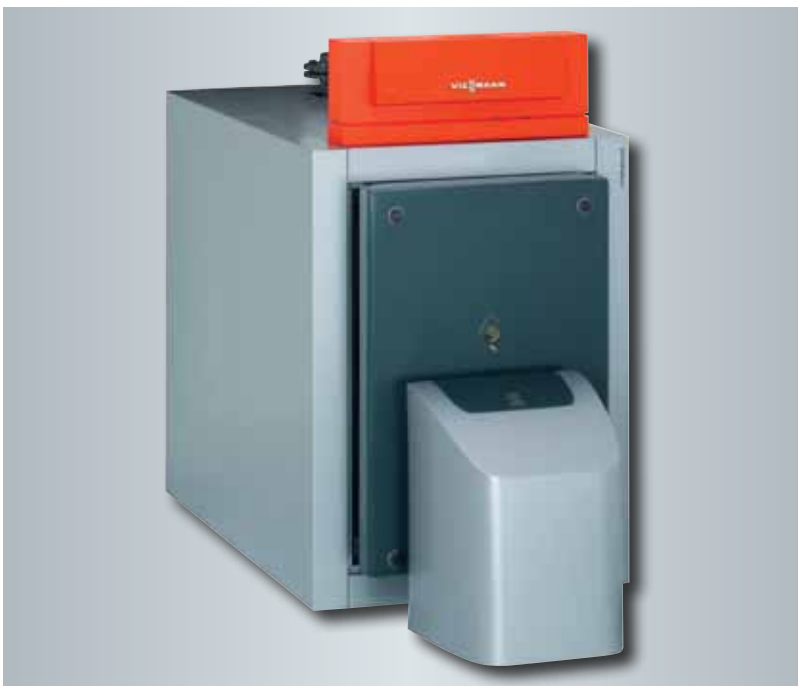
Vitoplex 200, 90–560 kW

Vitoplex 200 -kolmivetokattila on helppo asentaa, se säästää tilaa ja kävelynkestävä kulkutaso (yli 700 kW:n mallit) helpottaa asennusta ja huoltoa. Kompakti kolmivetokattila (enintään 350 kW:n mallit) mahtuu standardilevyisestä ovesta (80 cm), mikä helpottaa laitteen asennusta.